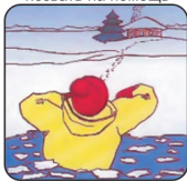
Выбираться в сторону, с которой произошло падение