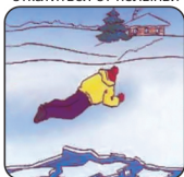
Проползти 3-4 метра по своим следам