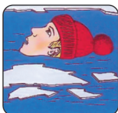
Не погружаться в воду с головой