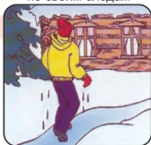
Не отдыхая, бежать к ближайшему жилью

Собираясь выйти на лед водоёма помните о мерах безопасности и правилах поведения на льду!