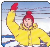
Не паниковать, позвать на помощь