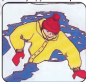
Забросить на лёд ногу, откатиться от полыньи