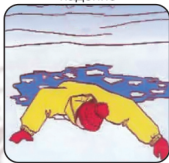
Наползая на лёд, раскинув руки в стороны